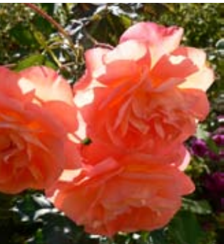
Moderní kultivary růží mají velmi výrazné barvy – jako tato keřová růže 'Westerland'