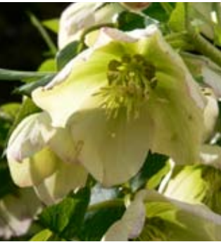
Čemeřice ( Heleborus niger ) je stále oblíbenější trvalkou časného jara