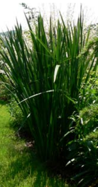
Trávníková cesta klikatící se mezi vyšší zelení je velmi efektním prvkem zahrady